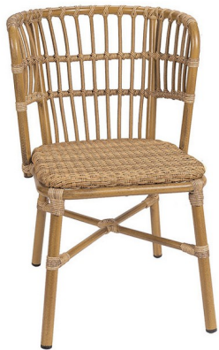
Deco Bambú/ Trenzado Atlas