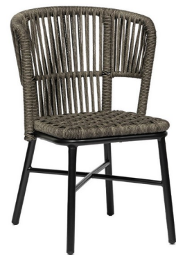
Negro/ Cuerda Gris