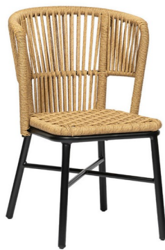
Negro/ Cuerda Crema