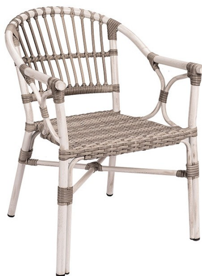
Deco Blanco/ Trenzado Gris