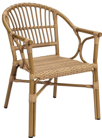
Deco Bambú/Trenzado Atlas