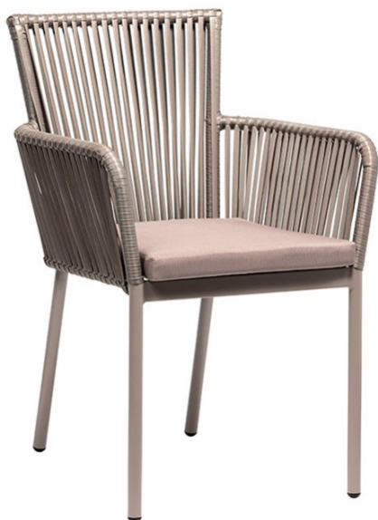
Deco Stone / Trenzado Stone