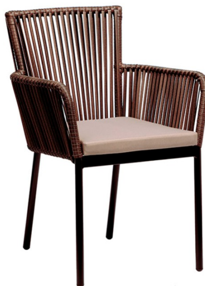
Negro / Trenzado Marrón