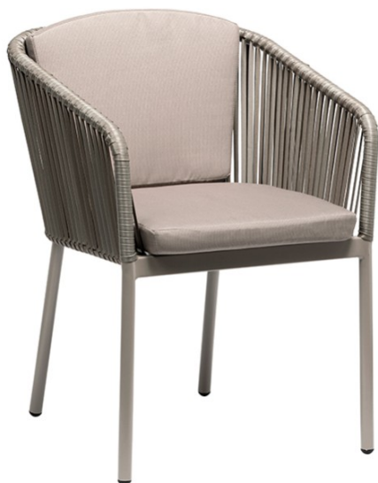
Deco Stone / Trenzado Stone