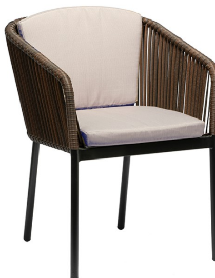
Negro / Trenzado Marrón