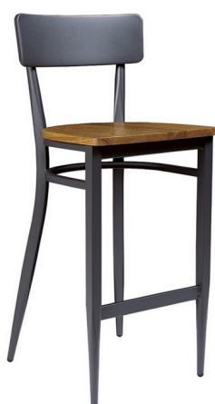
Grafito/ Madera Macizo