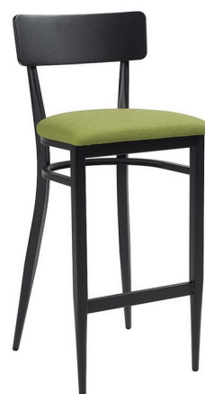
Negro / P.U. Verde