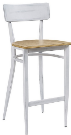
Blanco envejecido / Laminado Roble Vintage