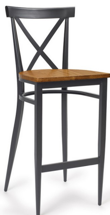
Grafito/ Madera Macizo