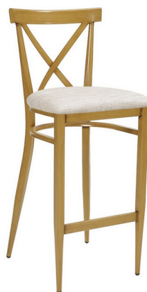
Deco Natural/ P.U. Indiana