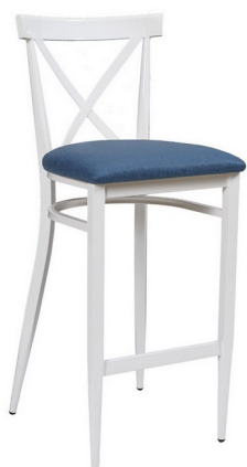
Blanco/ P.U. Azul