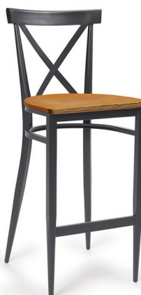
Negro/ Laminado Natural