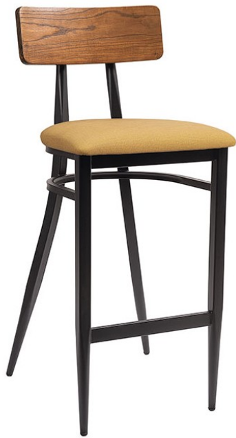
Negro/ P.U. Mostaza