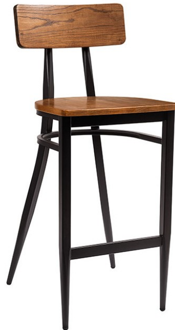
Negro / Madera macizo