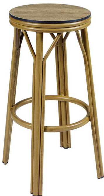
Deco Bambú/ Compacto Rural