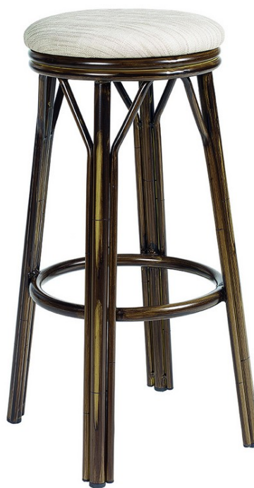
Deco Nogal/ P.U. Indiana