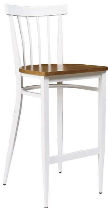
Blanco/ Madera maciza