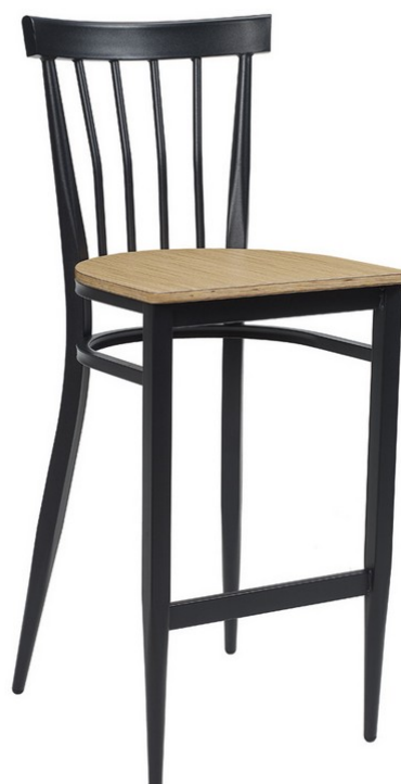
Negro/ Laminado Kenya