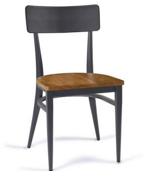
Grafito/ Madera macizo