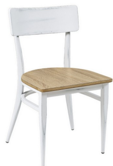
Blanco envejecido/Laminado Roble vintage