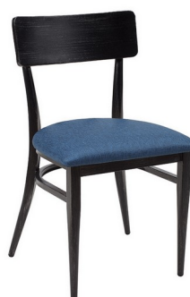
Negro envejecido/ P.U. Azul