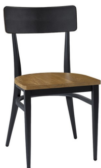
Negro/ Madera macizo