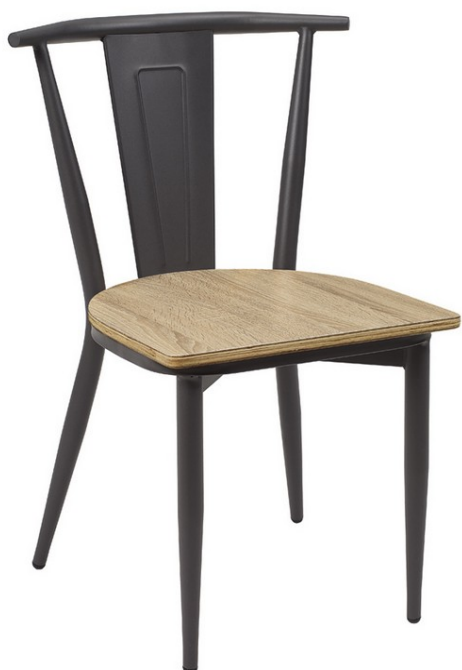
Grafito / Laminado Roble Vintage