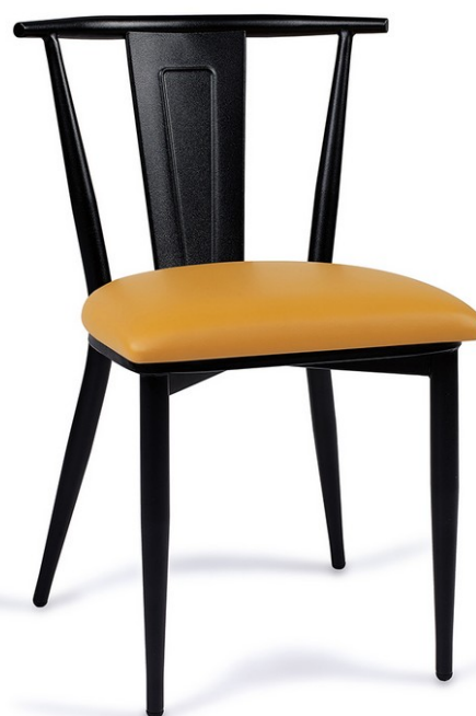
Negro / P.U. Panamá